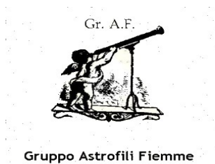
Gruppo Astrtografi Fiemme