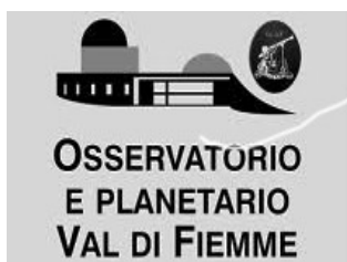
Osservatorio Planetario di Fiemme